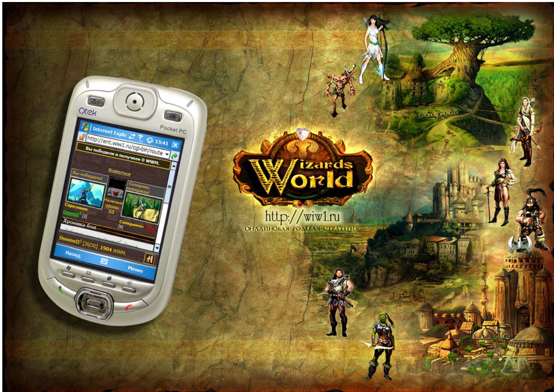
Мобильное будущее: онлайн-миры ВИБ